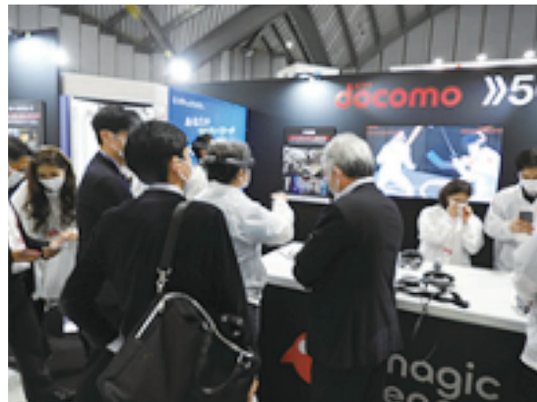
5G・AIを体験、説明を受ける部会参加者

2日目のResorTech Okinawa『おきなわ国際IT見本市(2019年度プレ開催)』視察では、リゾート沖縄では、5GとAIを駆使した新しいコンテンツや、体験型ブースが多く、特に観光客の利便性と安心安全を提供するタクシーアプリやコンシェルジュ機能付き観光案内板、また、イベント会場入口などで活用できるIoT(入場者認証システム)や、電動キックバイクなど全ての産業に有効なICT技術の他、観光産業や健康などに特化した商材や、焼失する前の首里城をVRで体験するなどの観光産業に特化したサービス業向けのソリューションなどに触れる事が出来ました。